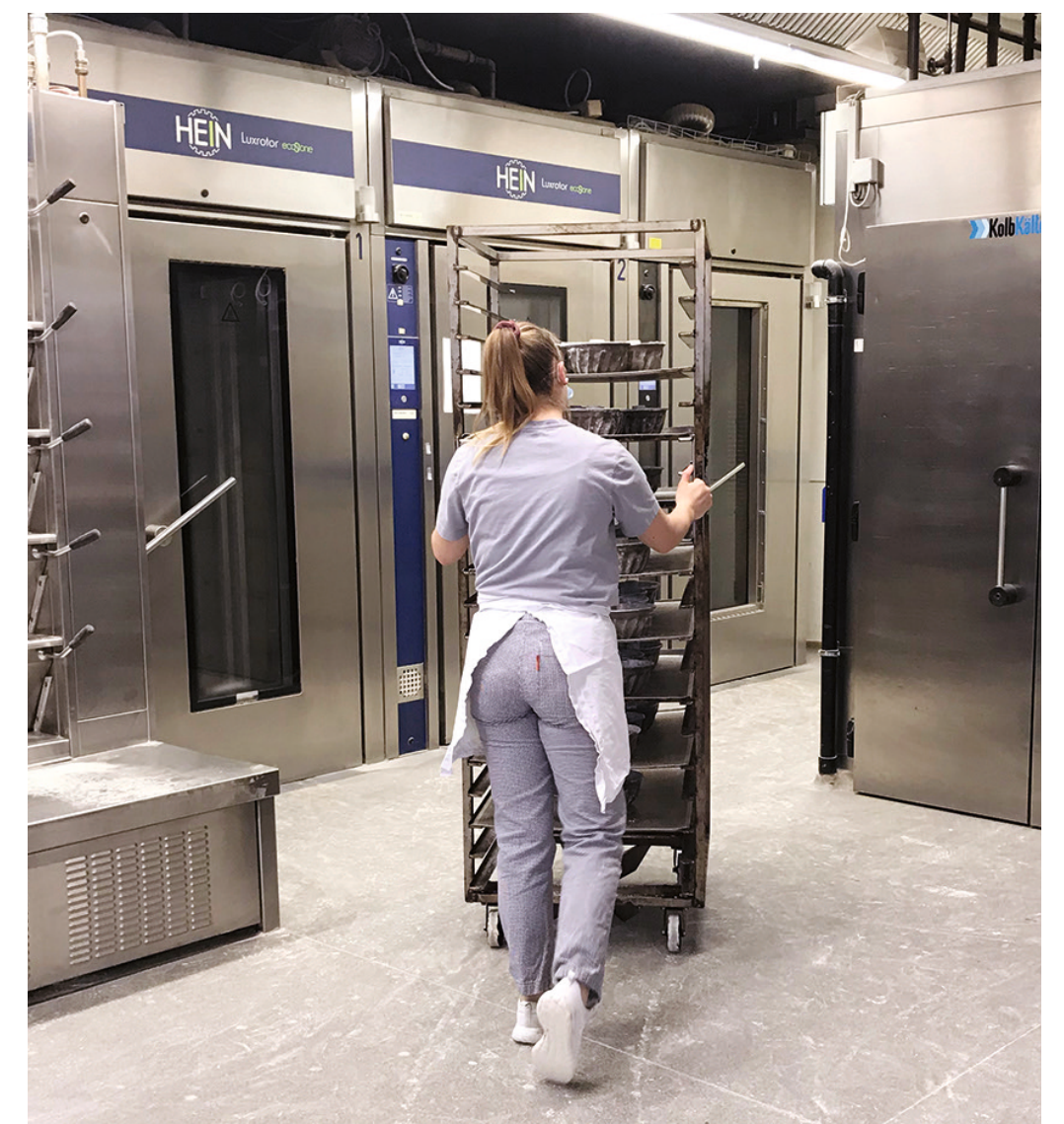
Immagine: CSFL 6207